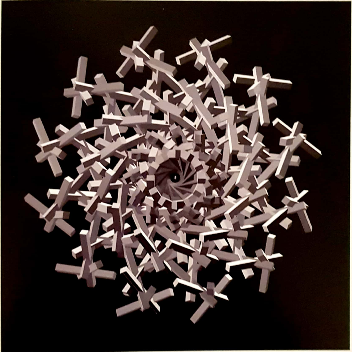
"Fractal Flowers B&W #7", Miguel Chevalier, 2008 Lightjet print on Kodak paper diasec mounted with frame in wood, cm 105x105